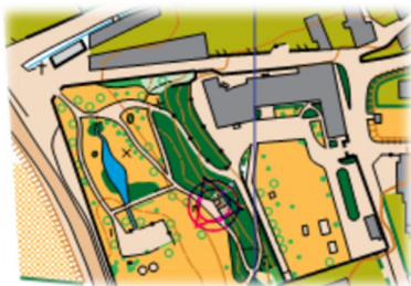
Extrait du parc des Echelles